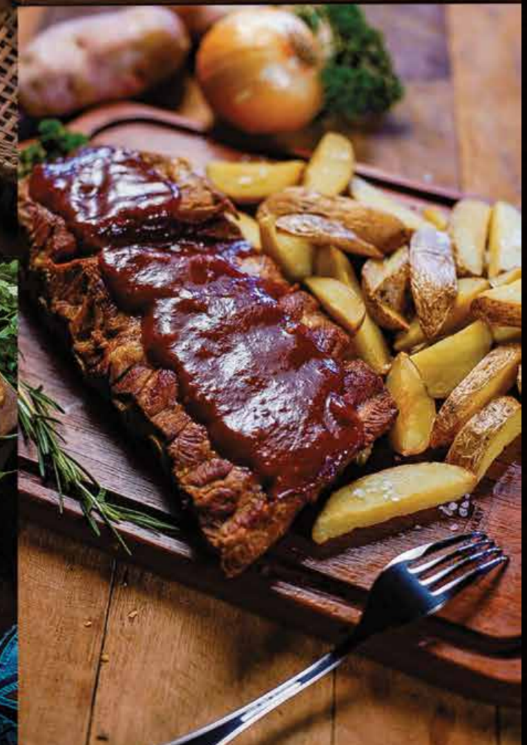
• Costela Suína com Barbecue