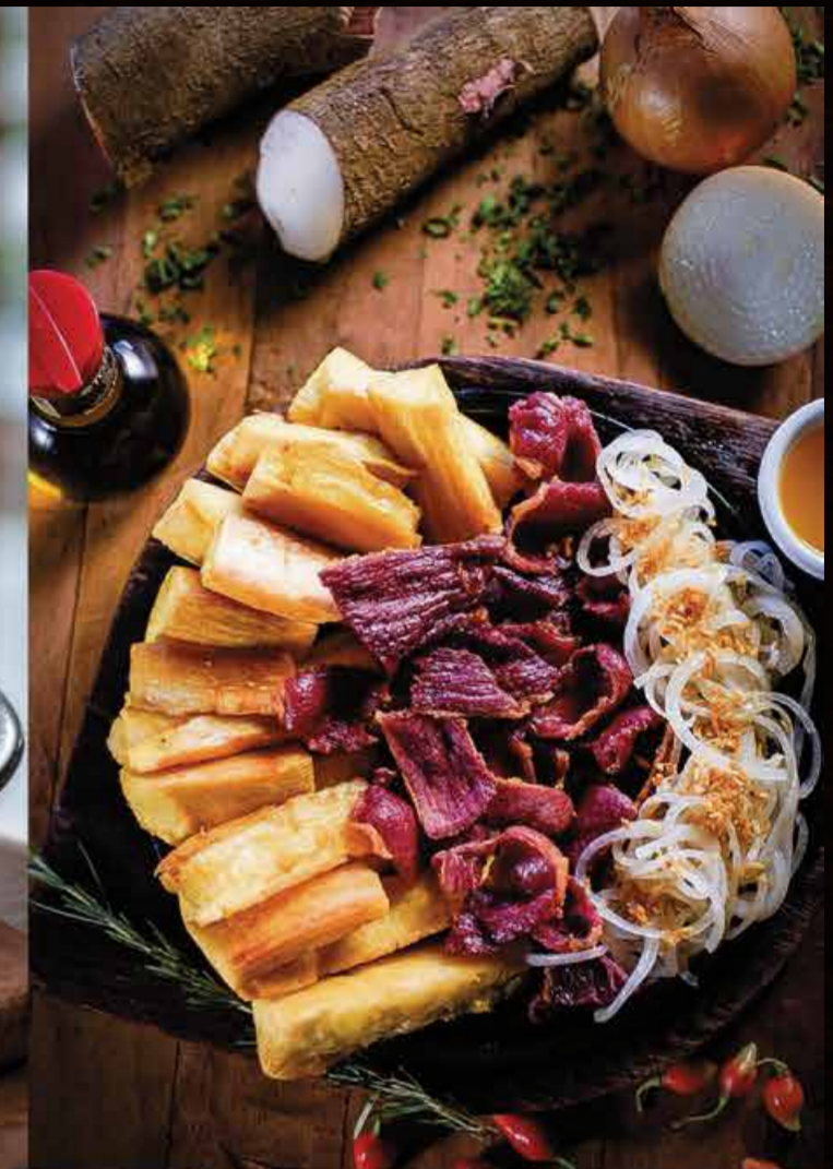
• Aipim com Carne Seca