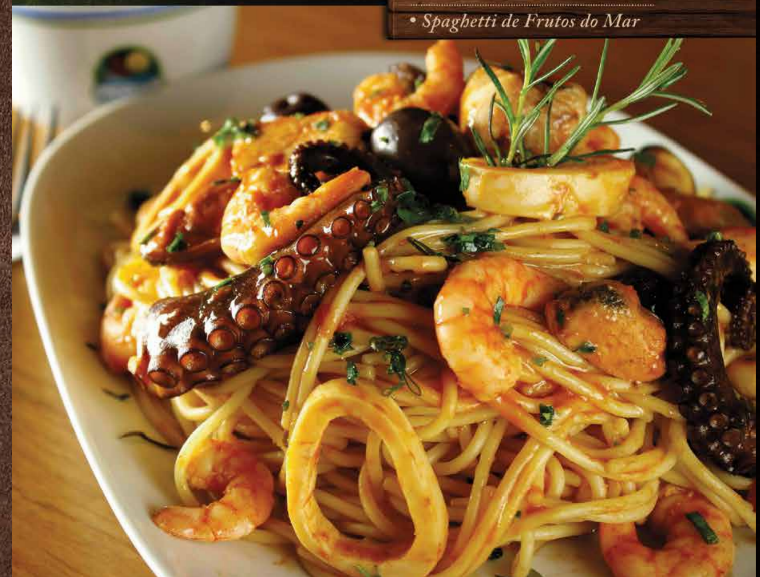
• Spaghetti de Frutos do Mar