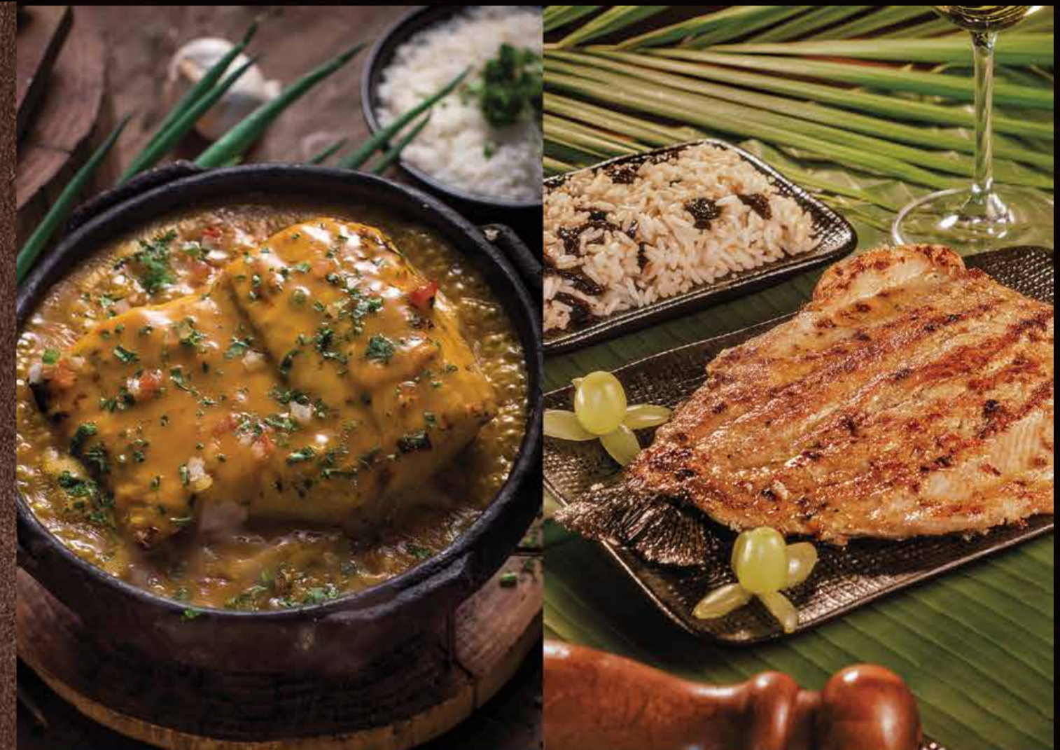
• Moqueca de Pirarucu • Banda de Tambaqui

ALGUNS PRATOS COM OPÇÃO DE 1/2 PORÇÃO, SERÁ COBRADO 60% DO VALOR. CONSULTE AO GARÇOM