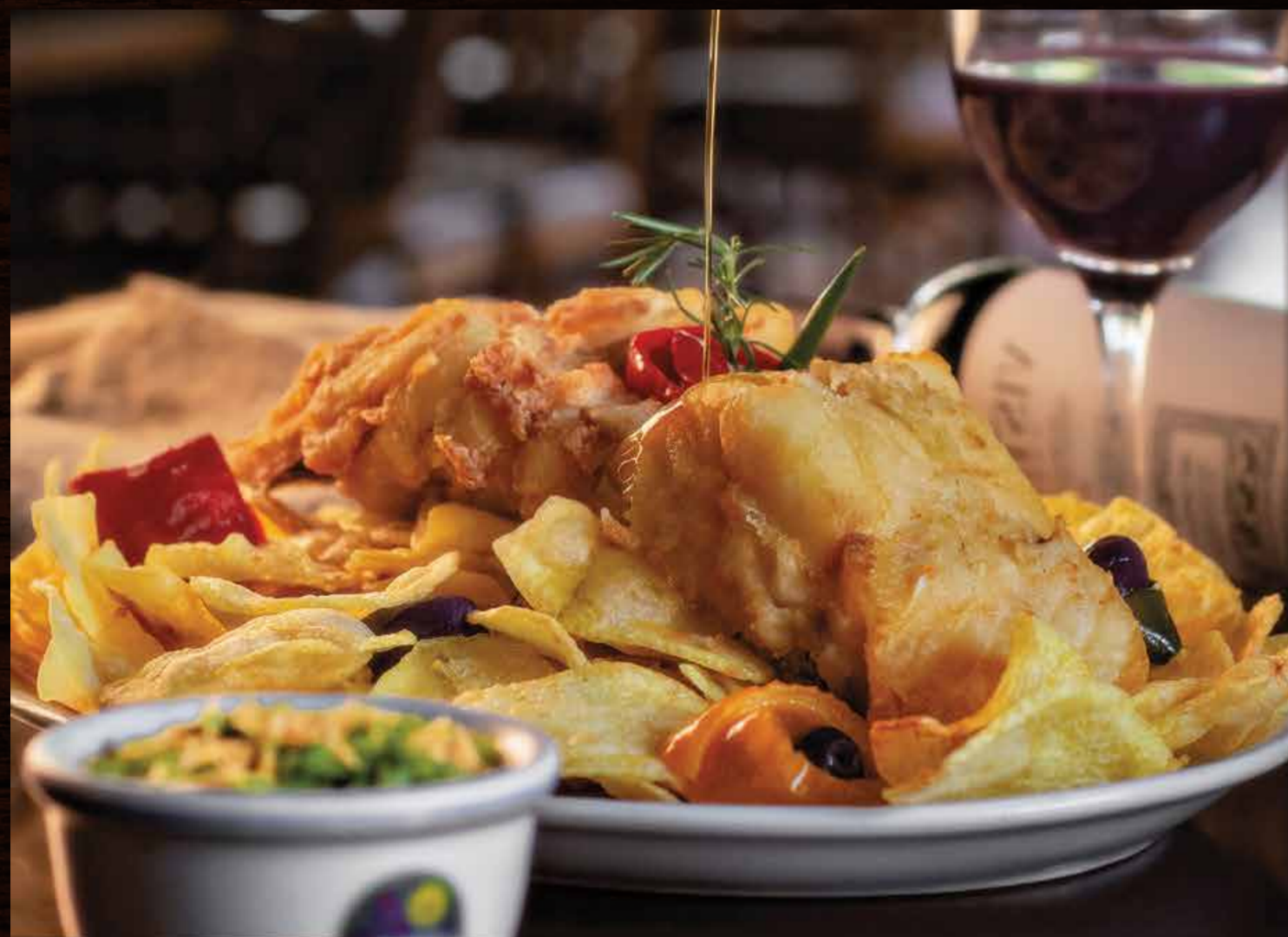
• Bacalhau ao Forno