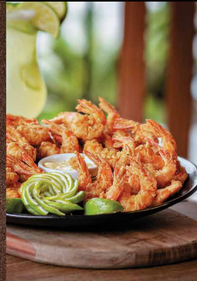
• Camarão Crocante

ALGUNS PRATOS COM OPÇÃO DE 1/2 PORÇÃO, SERÁ COBRADO 60% DO VALOR. CONSULTE AO GARÇOM