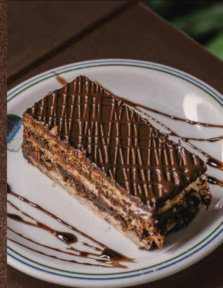
• Mil folhas

Adicional Morango..... R$ 3,00 Adicional Morango e Laranja ..... R$ 2,00