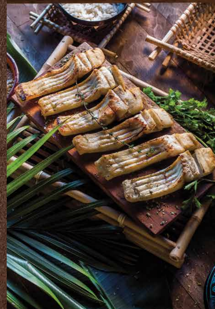
• Costela de Tambaqui Grelhada