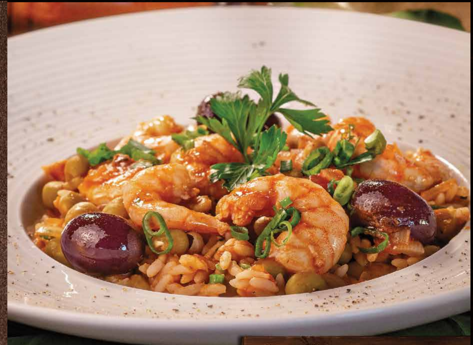
• Risoto de Camarão

ALGUNS PRATOS COM OPÇÃO DE 1/2 PORÇÃO, SERÁ COBRADO 60% DO VALOR. CONSULTE AO GARÇOM