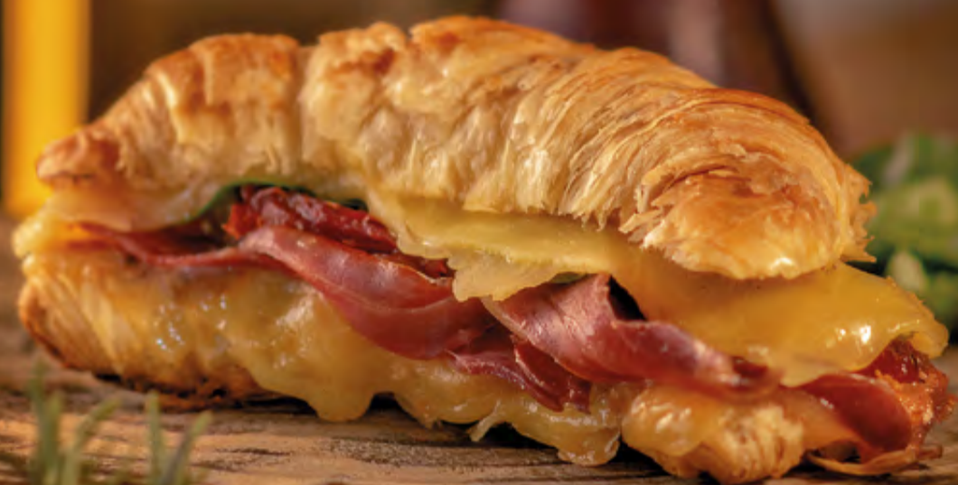
• CROISSANT ESPECIAL