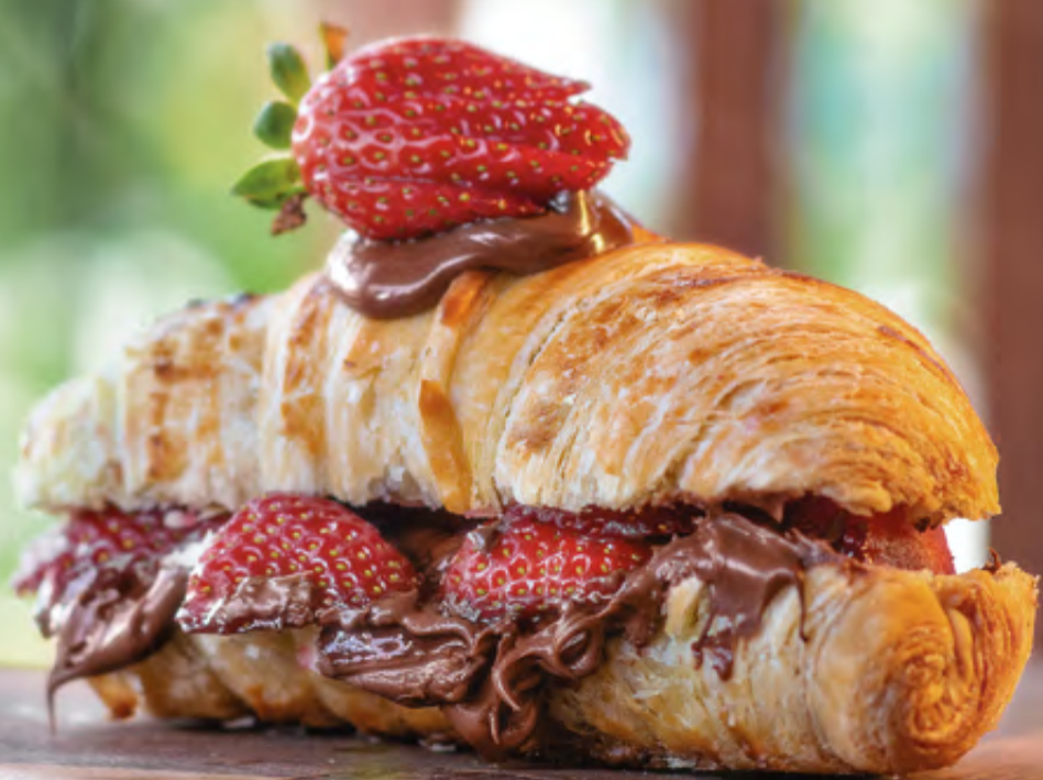
• CROISSANT NUTELLA COM MORANGO